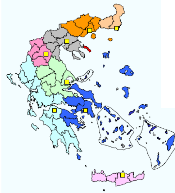
Εικόνα 1: Κέντρα συλλογής και περιοχές εξυπηρέτησης του ΣΣΕΔ ΕΛΤΕΠΕ/ ΕΝΔΙΑΛΕ 180